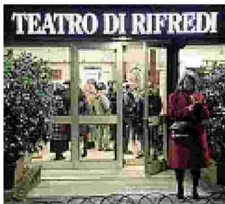
Teatro Rifredi (Gasperini/Sestini)

La crisi del Teatro della Toscana e i rischi per Rifredi, i grandi vecchi palchi che faticano e le piccole realtà che proliferano, alcune bandiere che risorgono e altre che scompaiono. Quartiere per quartiere vediamo come è cambiata l'offerta culturale dei teatri di Firenze.