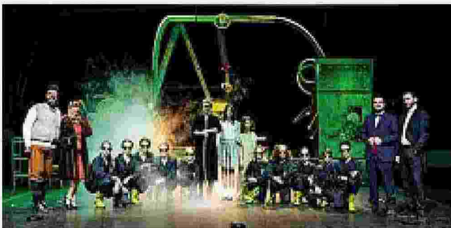
Punto di riferimento del quartiere Il Teatro di Rifredi in via Vittorio Emanuele II