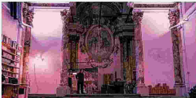
Dai templari alle performance di arte contemporanea Il Gada Playhouse in via dei Macci, nato in una ex chiesa

Ritaglio stampa ad uso esclusivo del destinatario, non riproducibile.