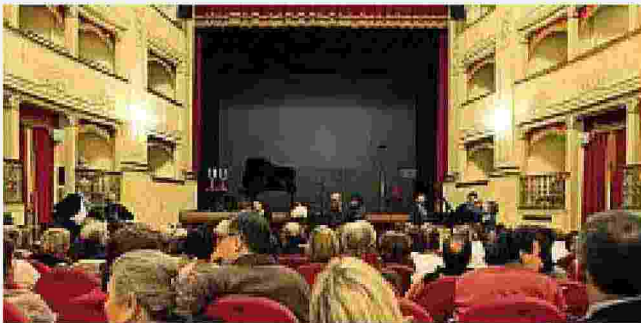
Simbolo dell'Oltrarno Il Teatro Goldoni che ora ospita il Teatro delle Donne ( Bramo/Sestini )