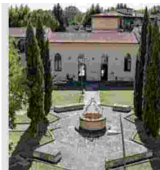
► Vignolini in Firenze I