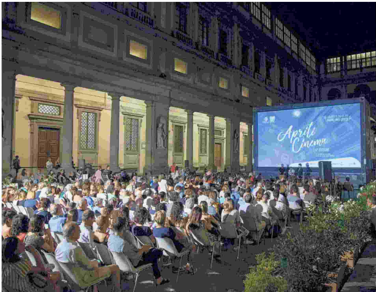
◀ Nel Cortile Il cinema nel Cortile degli Uffizi